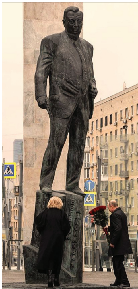
На торжественной церемонии выступил В. В. Путин.

«...Многие люди в России и за рубежом, — сказал он, в частности, — помнят, думают о Евгении Максимовиче с огромным уважением, с теплотой и сердечной признательностью, с осознанием уникальности, неповторимости его личности, его ума, многогранного таланта, знаний и мудрости и неизменно высокого человеческого достоинства.